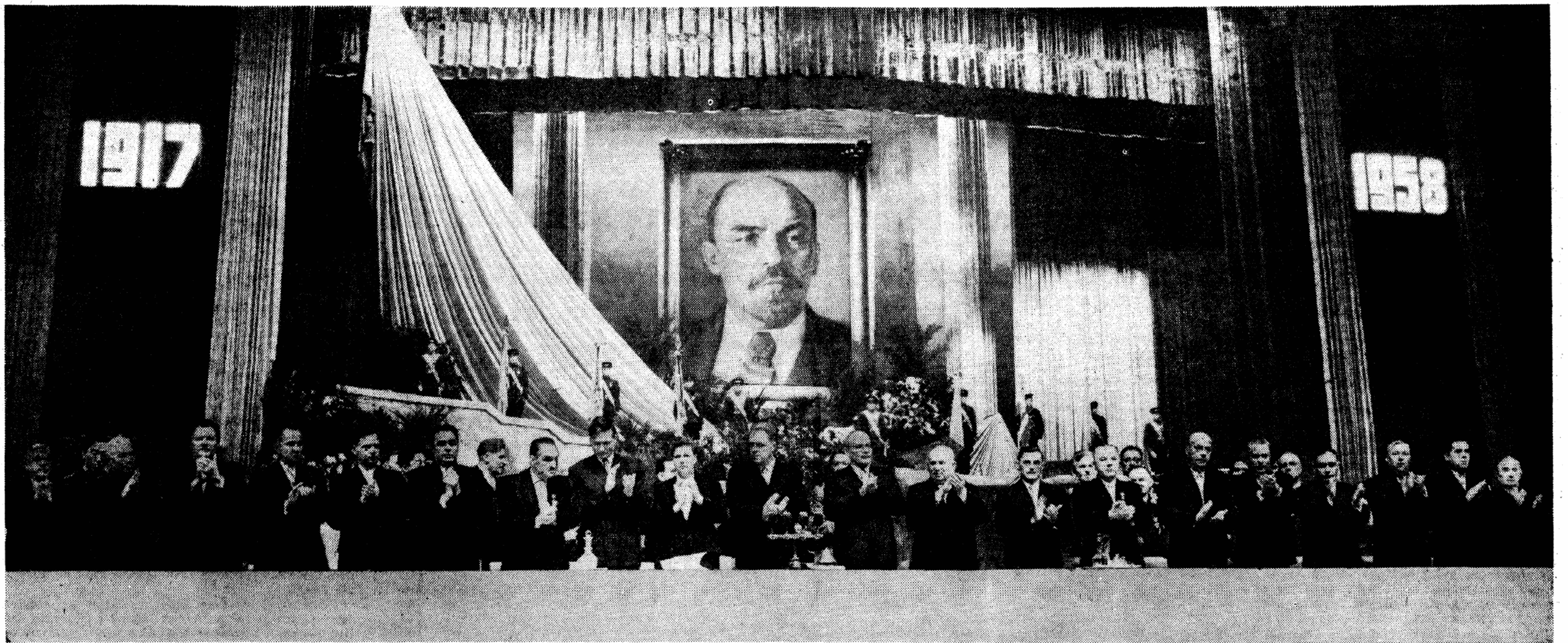
Москва. Дворец спорта Центрального стадиона имени В. И. Ленина. 6 ноября 1958 года. Президиум торжественного заседания Московского Совета депутатов трудящихся, посвященного празднованию 41-й годовщины Великой Октябрьской социалистической революции.

Да процветают народы Советского Союза на светлом пути строительства коммунизма!